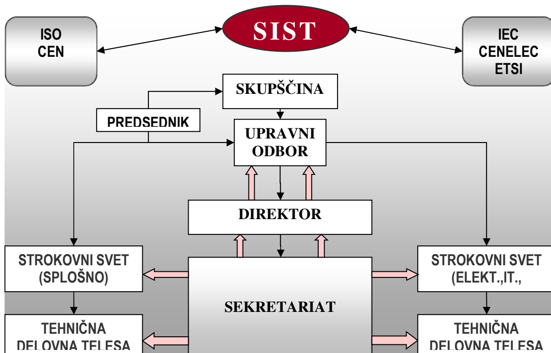
Slika 1: Organigram SIST

Sekretariat SIST, kot strokovno-administrativna služba, podpira izvajanje dejavnosti slovenske nacionalne standardizacije. SIST Sekretarit je organiziran, kot kaže slika 2.